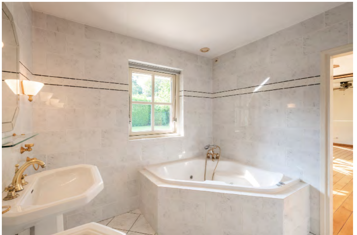
HOOFDSLAAPKAMER MET BADKAMER EN-SUITE