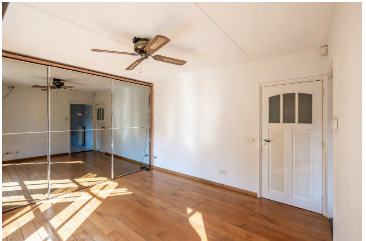
HOOFDSLAAPKAMER MET BADKAMER EN-SUITE