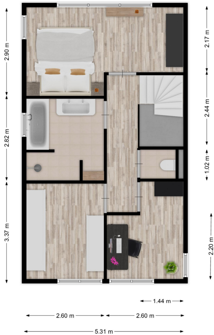
Schriekse Heihoek 102 te Berghem - Eerste verdieping Plattegronden zijn ter indicatie. Aan de maatvoering en indeling kunnen geen rechten worden ontleend.

Plattegronden zijn ter illustratie en kunnen op bepaalde punten enigszins afwijken van de werkelijkheid.